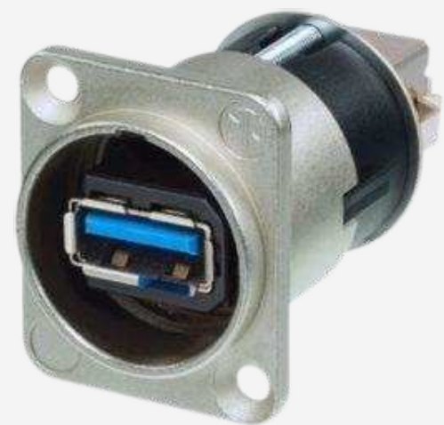
Видео адаптеры и переходники от 630 р.