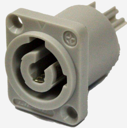
Разъёмы Powercon от 140 р.