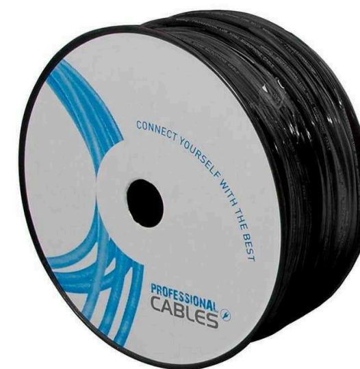
Инструментальные кабели от 50 р.