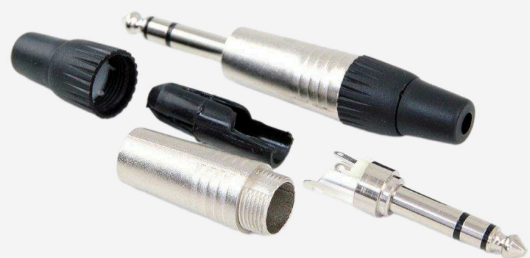
Разъёмы Jack от 90 р.