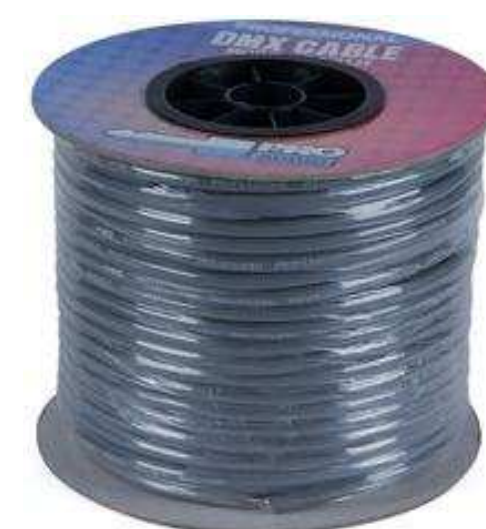
Кабели цифровые (DMX) от 70 р.