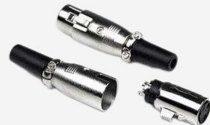
Разъёмы XLR от 60 р.

Подберем оборудование точно под задачу по этим характеристикам: