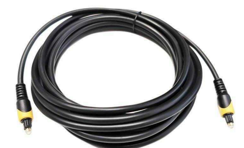
Распаянные аудио кабели от 200 р.