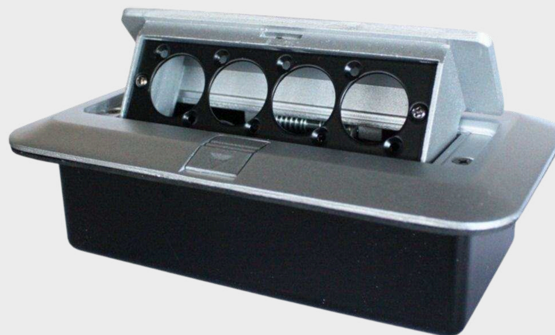
Коммутационные коробки от 3 750 р.