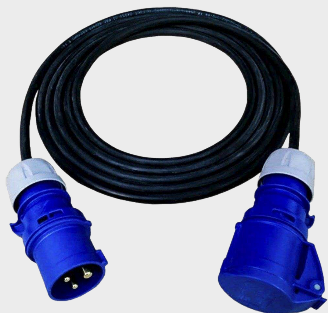
Силовые кабели и удлинители от 2 280 р.