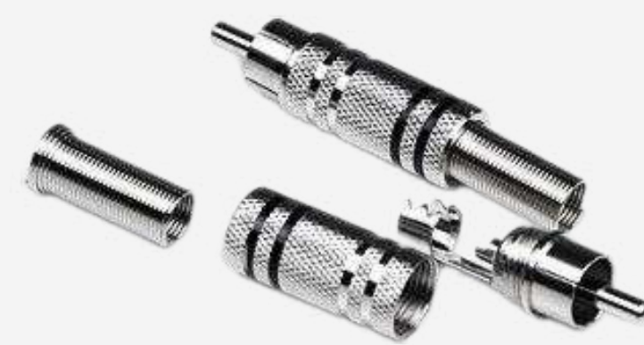
Разъёмы RCA от 120 р.