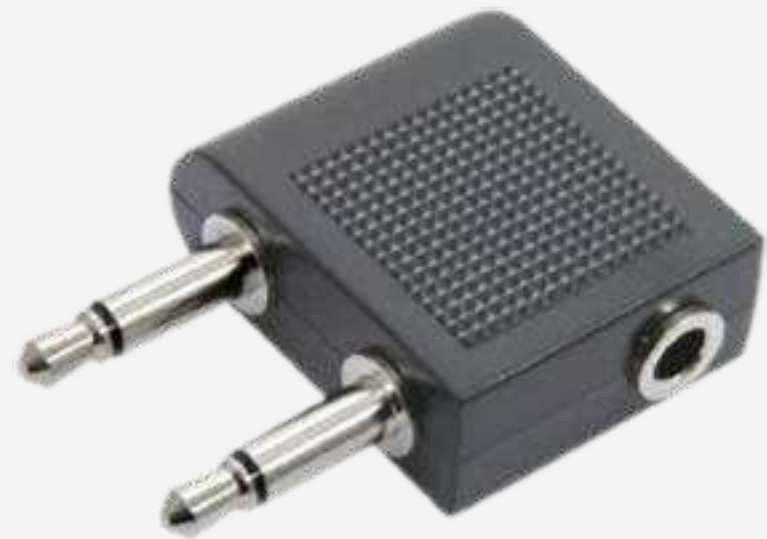
Аудио адаптеры и переходники от 50 р.