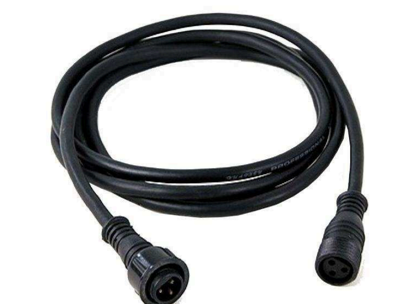
Распаянные кабели DMX от 440 р.