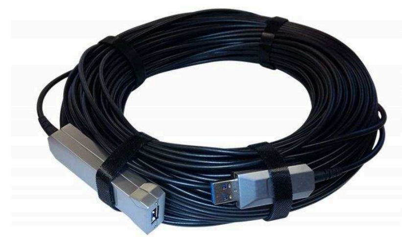
Распаянные USB-кабели от 570 р.