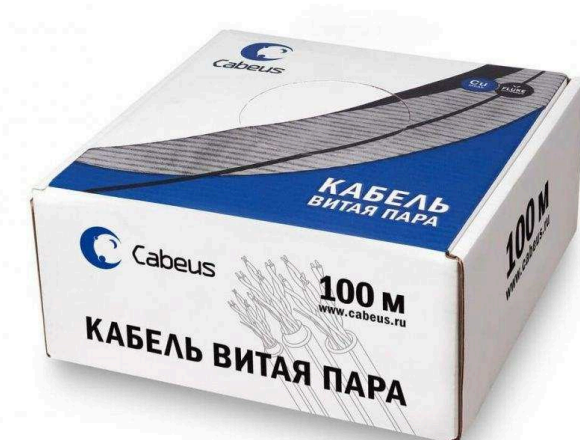
Кабели витая пара UTP от 18 830 р.