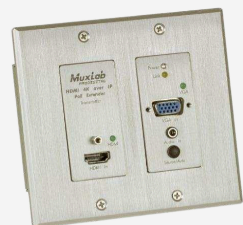
Видео розетки (HDMI розетки) от 540 р.