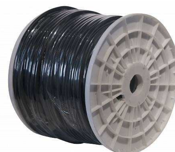
Кабели для громкоговорителей от 70 р.

Подберем оборудование точно под задачу по этим характеристикам: