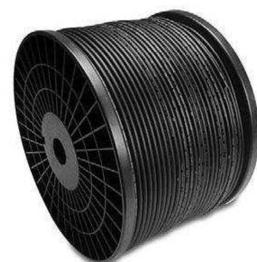
Микрофонные кабели от 50 р.