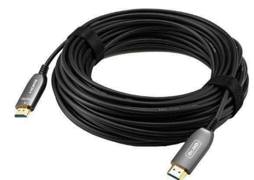
Распаянные видео кабели от 210 р.