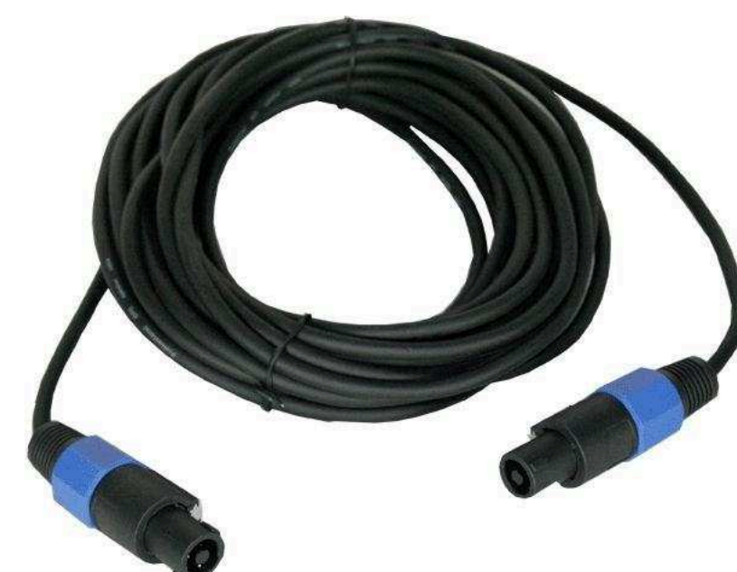
Распаянные кабели Speakon - Speakon от 890 р.