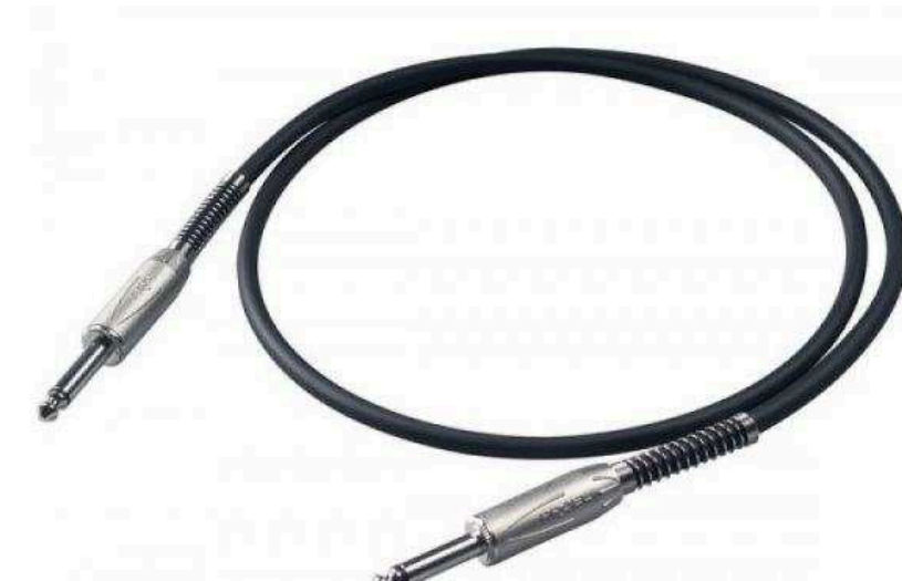
Распаянные кабели Jack – Jack от 160 р.