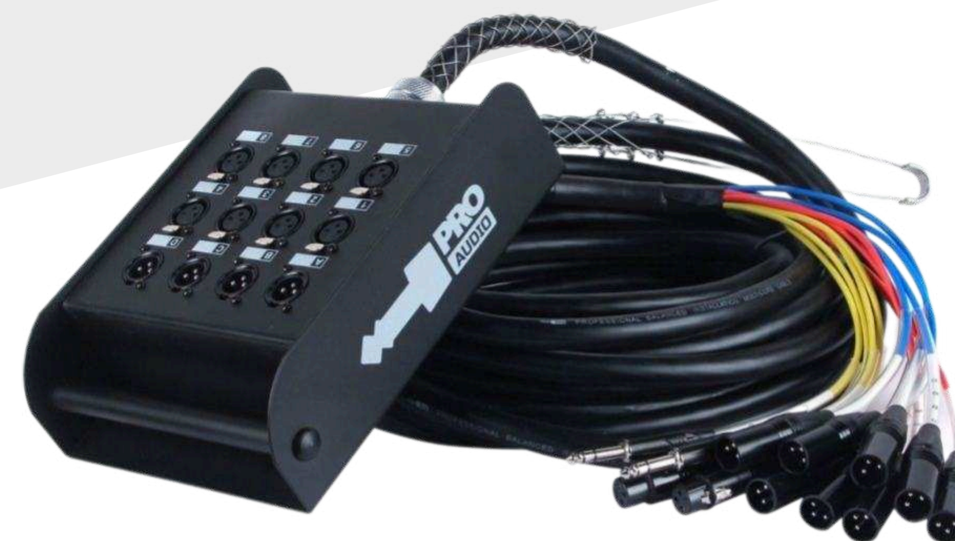
Мультикоры от 220 р.