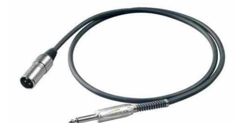
Распаянные кабели XLR – Jack от 480 р.