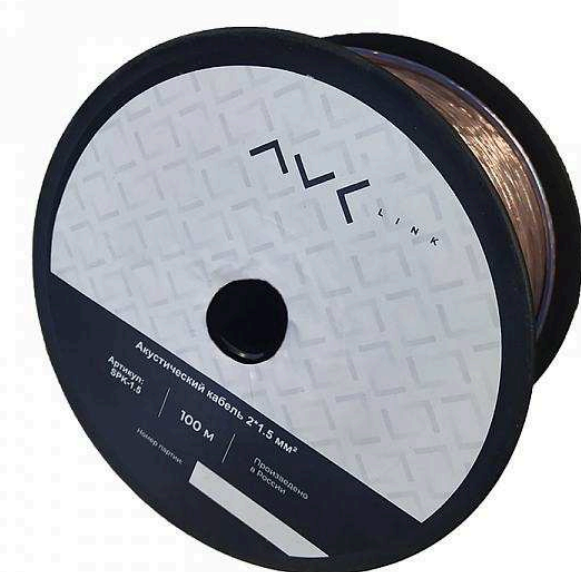
Аудио кабели от 100 р.