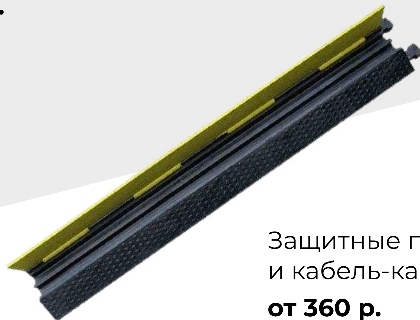
Защитные пороги и кабель-каналы от 360 р.