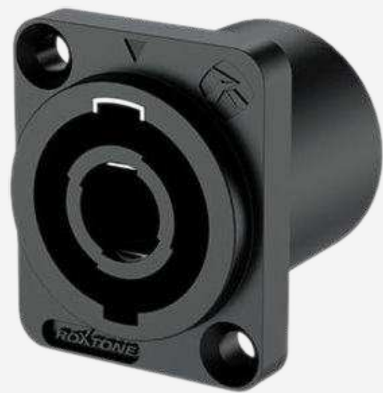
Разъёмы Speakon от 90 р.