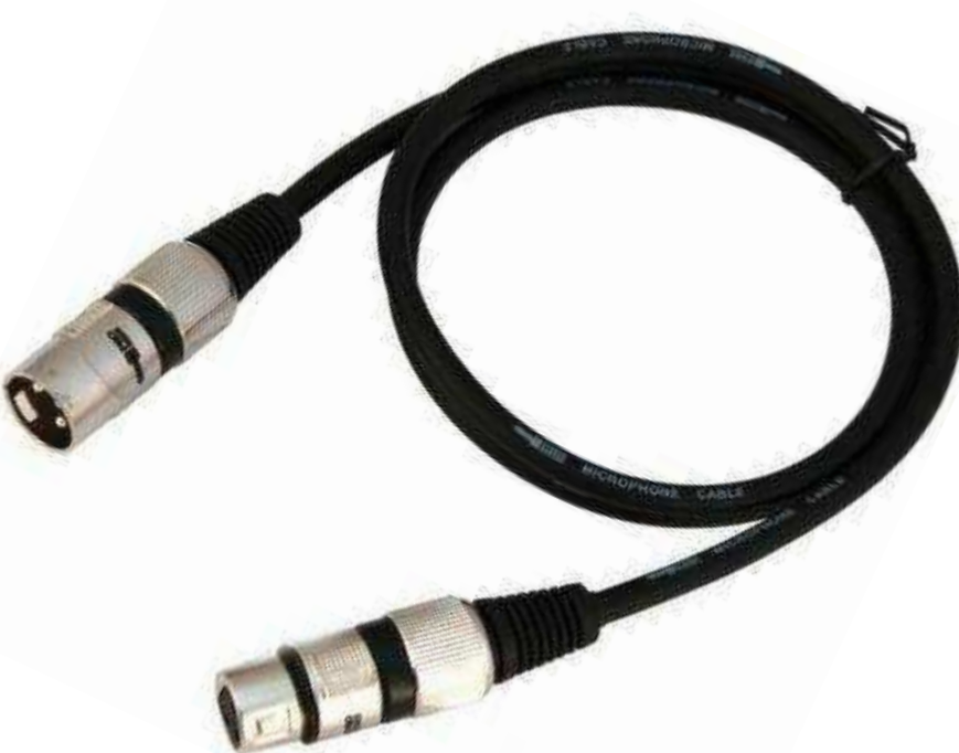
Распаянные кабели XLR - XLR от 410 р.

Подберем оборудование точно под задачу по этим характеристикам: