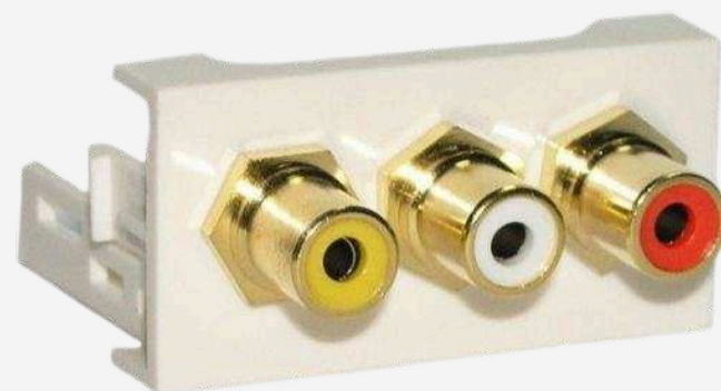
Аудио розетки от 530 р.